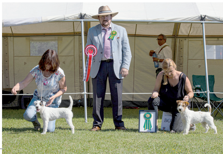
Art-Trophy Folder.indd 1-3

ab 7:30 Uhr Einlass der Hunde 09:30 Uhr Richten „Simon Mills Cup“ anschließend Siegerwahl im Ehrenring